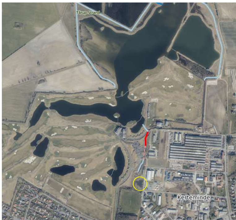
Figur 1: Placering af pågældende vandløb (blå/rød linje), reguleringen (fremhævet med rød) og regnvandsbassin i syd (gul ring). Rød stiplede linje indikerer nuværende rørlægning af vandløb, rød fed linje indikerer ønsket rørlægning af vandløb.

Vandløbet starter ved udløb af et regnvandsbassin i syd og har udløb i Sybergsøen (se figur 1). Vandløbet er i alt ca. 350 m lang, og er på nuværende tidspunkt delvist rørlagt flere steder, med en samlet rørføring på ca. 120m. Efter reguleringen vil ca. 210m vandløb være rørlagt.