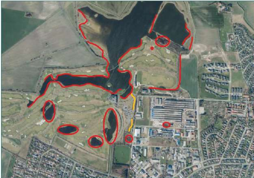
Figur 3: Oversigt over undersøgelsesområder efter bilag IV-arter (markeret med rød og orange).

Kerteminde Kommune afgør på denne baggrund, at projektet ikke kræver en konsekvensvurdering af Natura 2000-områder samt bilag IV-arter. Afgørelsen er begrundet i, at miljøpåvirkningens omfang ikke er af en sådan karakter og/ eller grad, at aktiviteterne må antages at kunne få væsentlig indvirkning på miljøet.